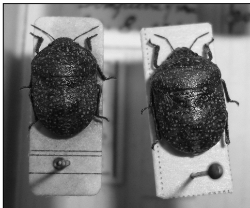
Fig. 1 – Deux spécimens du rare Psacasta exanthematica , tout au moins au nord de sa distribution comme ici en Vendée.