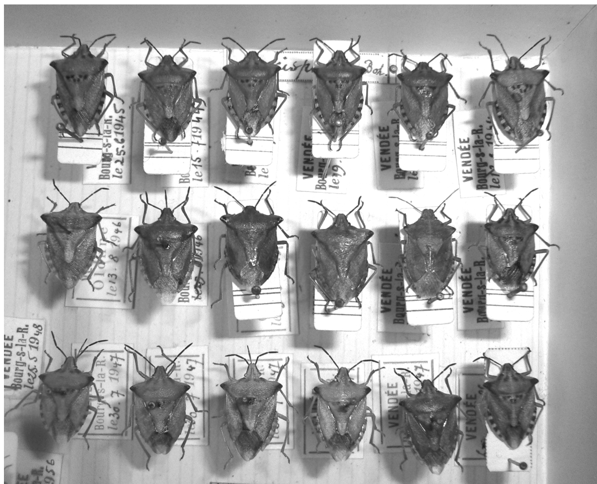
Fig. 2 – Trois rangées de Carpodis mediterraneus atlanticus Tamanini, 1958. L'espèce n'était pas encore décrite lors des captures de Georges Durand.